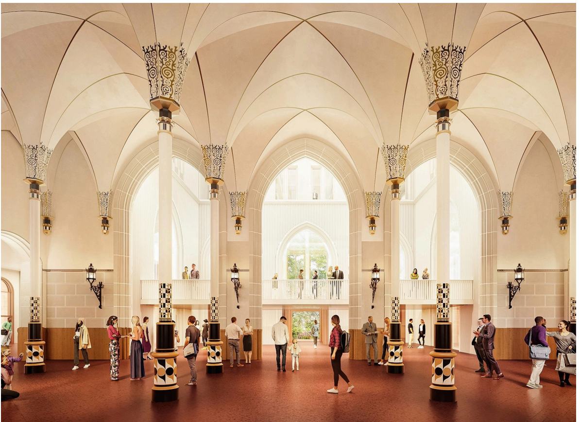
Fünf Abteilungen des Präsidialdepartements ziehen in luftige Höhen in die sanierte alte Hauptpost. Das hat für Kritik gesorgt. Visualisierung: Herzog und de Meuron

Die GPK verlangt in diesem Zusammenhang eine umfassende Analyse der Ursachen für die ansteigenden Ausgaben. Es sollen dabei auch verschiedene Optionen vertieft geprüft werden, um dieses Kostenwachstum zu beschränken.