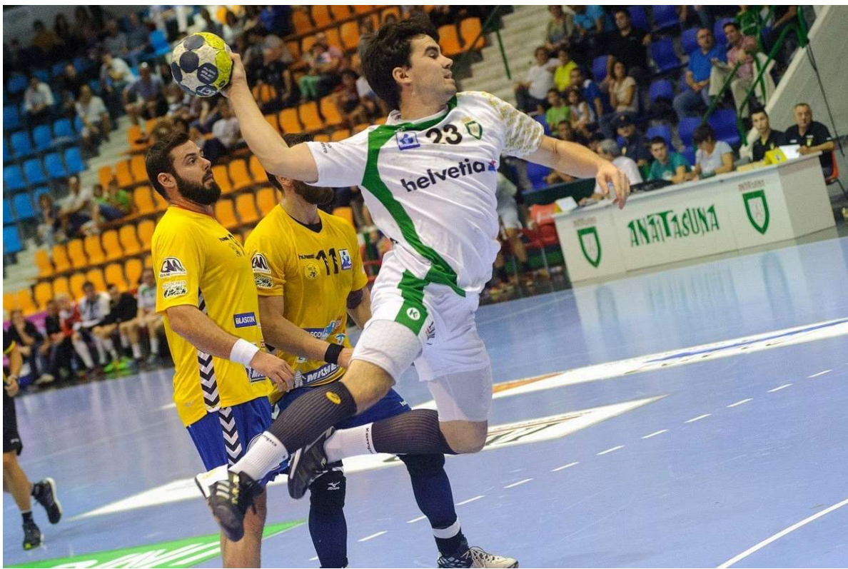
Die Belegung von Sporthallen wird in anderen Städten mühelos online abgewickelt – nicht so in Basel.