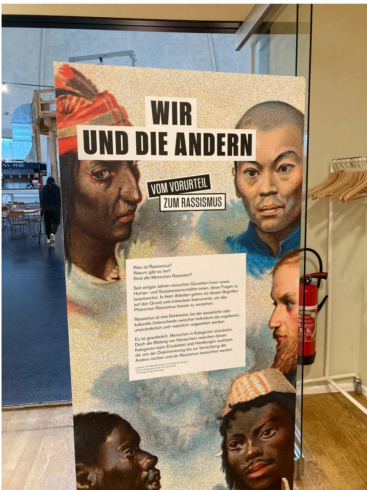
Die Plakatausstellung beschäftigt sich mit rassistischen Vorurteilen.

Vorurteile entstünden schon früh, durch Medien, Kinderbücher, Familie, und eben auch Schule. Viele Lehrmittel würden einseitige Bilder vermitteln, so zum Beispiel das stereotype Bild der «Lehmhütte» für den afrikanischen Kontinent.