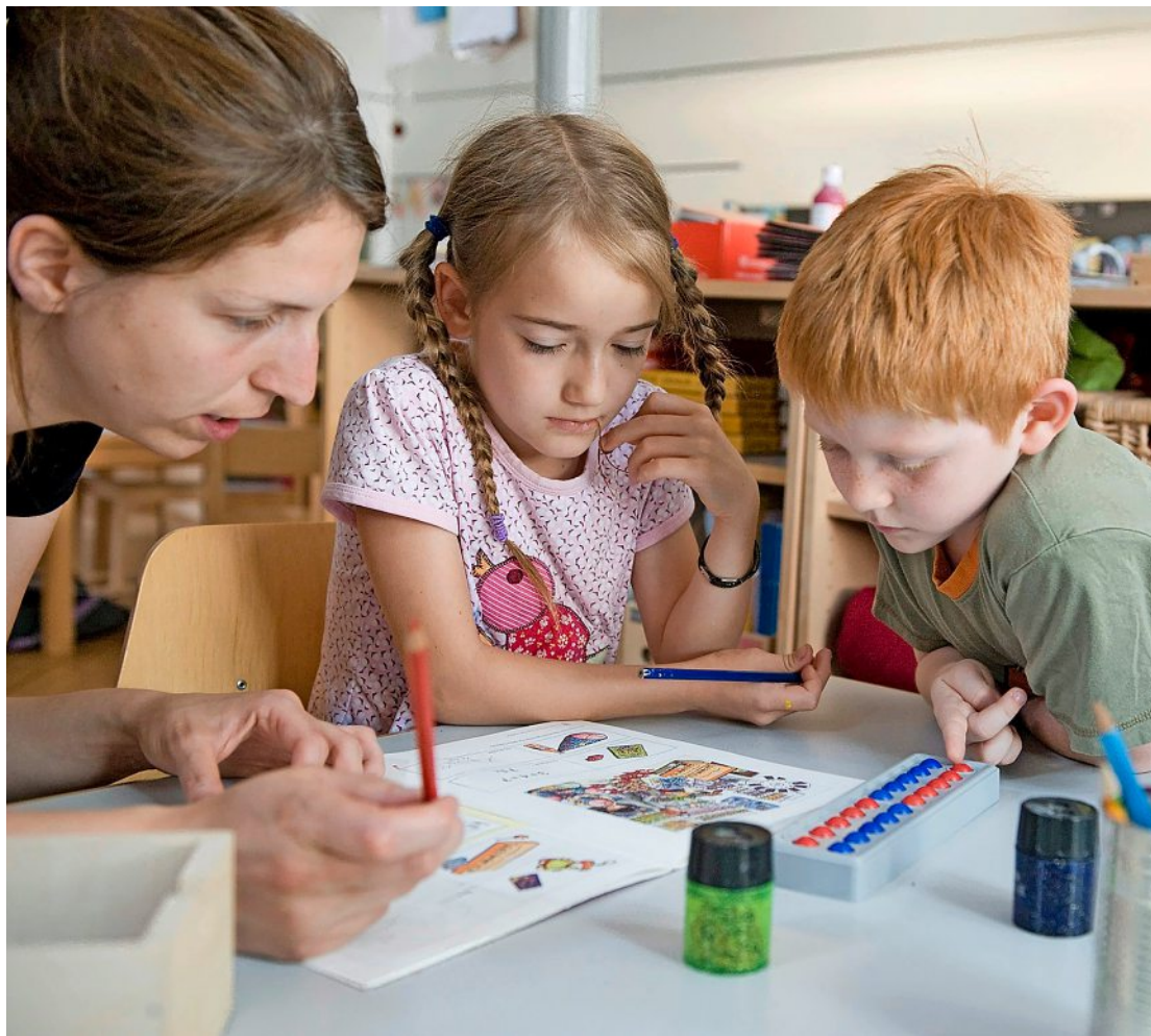
Früher glich der Job einem Hütedienst, heute sind Kindergärtnerinnen ausgebildete Lehrerinnen.